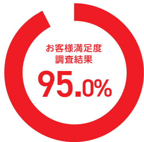
(満足～やや満足) (2024年度)

「お客様に、より満足いただく」ことを目指して、お客様を取り巻く多様化するリスクに的確に対処、アドバイスができるようリスクコンサルティングにも注力しています。